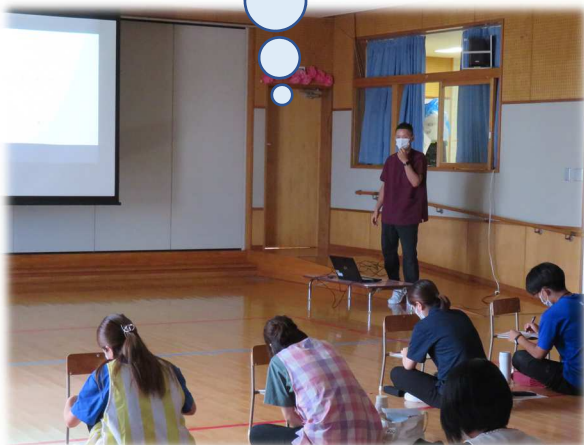
看護師による園内研修

実際に緊急時の一連の流れで役割を分担し救急車が到着するまでの対応をシミュレーションしました！