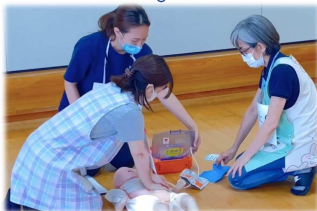
緊急時シミュレーション

公立保育所では、心肺蘇生法、アレルギー、骨折、熱中症など緊急性の高い状態の対応について看護師による園内研修を年に数回実施しています。また、園児の体調不良やケガをした場合を想定したフローチャートを作成し、職員でシミュレーションを実施しました。その様子を動画にまとめ、園内研修を通して緊急時に迅速かつ的確な対応ができるように対策をしています。