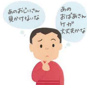
高齢者の近所のみなさん

高齢者についての心配ごと、介護での疲れや悩みなど、どんなことでも構いませんので、ご相談ください。