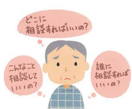
高齢者のみなさん

地域包括支援センターは、高齢者のみなさんはもちろん、そのご家族や高齢者の近所にお住まいのみなさんもお相談いただけます。些細なことでもかまいませんので、困ったことや心配ごとは、まずは地域包括支援センターへご相談ください。