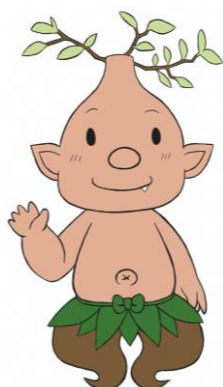
がじゃんくん (けんしん応援キャラクター)