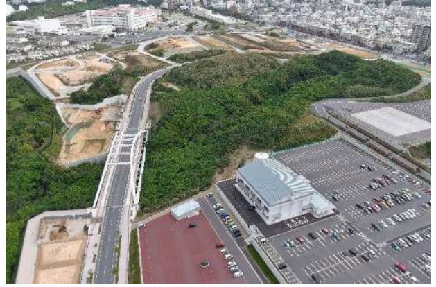
那覇広域都市計画事業 西普天間住宅地区土地地区画整理事業 設計図