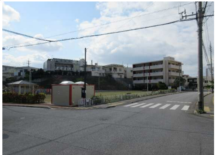
土地区画整理事業設計図及び区内現況写真