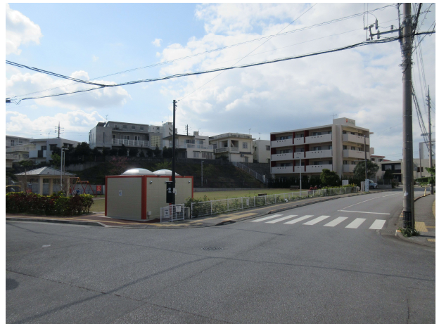
土地区画整理事業設計図及び区内現況写真