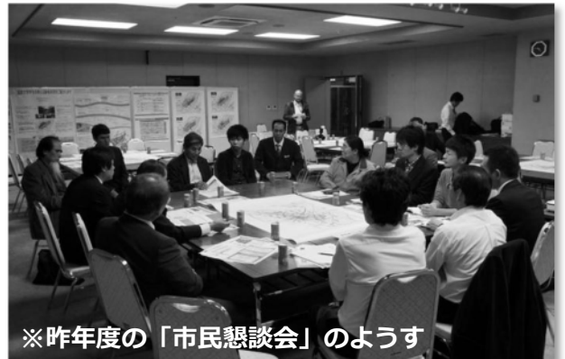
※昨年度の「市民懇談会」の様子

宜野湾市では、下記の日程で、市民の皆様を対象に普天間飛行場跡地利用に向けた「市民懇談会」を開催します。懇談会では、平成 23 年度に宜野湾市と沖縄県が共同調査で取りまとめた「広域緑地（普天間公園等）の計画方針」や市民のまちづくり検討組織「ねたてのまちベースミーティング」の活動内容等についてご紹介します。ご家族や近所の皆さんをお誘いの上、ぜひご参加下さい。