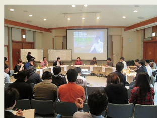
昨年度の Youth Conference okinawa2015の様子