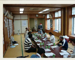
まちづくり座談会の様子