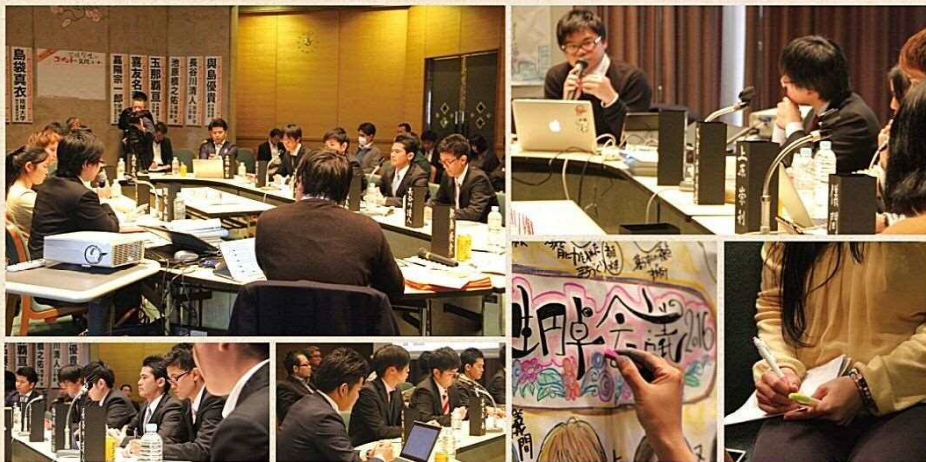
※写真は、平成 27 年度開催の「学生円卓会議 2016」のものです。