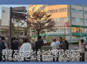
保育ステーションが設置されている駅前ビルを視察する様子

子供を預けると、市内32カ所ある保育園まで送迎するシステムになっている。子供を預けた後は、保護者はそのまま出勤できるため、親にとっては利便性の高い仕組みです。