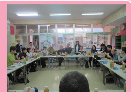
参加者から感想発表