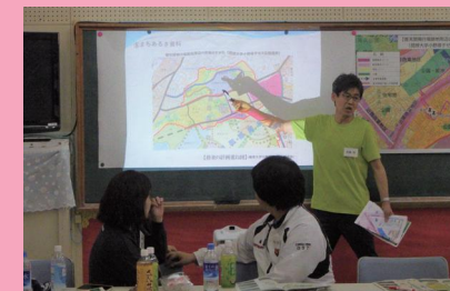
これまでに実施した新城区まちあるきや跡地利用計画についての説明