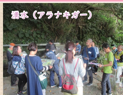
現在は農業用水として利用されている。