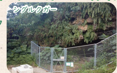
地域の拝所、ホテルの観察会の開催場所、組踊「銘苅子」の舞台

地域の歴史・文化・自然環境等の地域資源がコミュニティの中でどのように活用されているのか学びました。