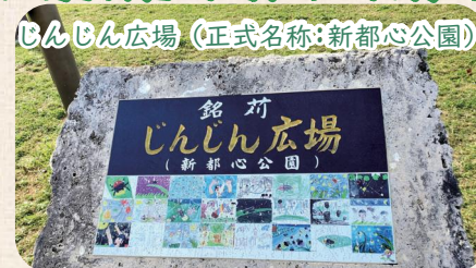
地域住民が名称を考えた地元小学生の絵画、地元書家の文字