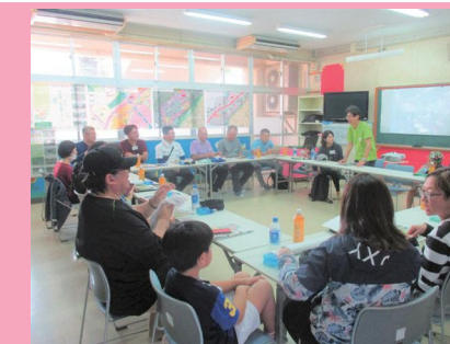
参加者から感想発表