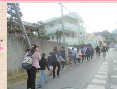
普天間飛行場方面の高台へ上る坂