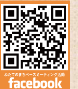
ねたてのまちベースミーティング活動 facebook

普天間飛行場跡地利用に係る情報は、宜野湾市ホームページや情報提供窓口（宜野湾市基地政策部まち未来課）でも提供しております。情報収集や跡地利用に係る要望・ご意見を述べる場としてお気軽にご活用ください。