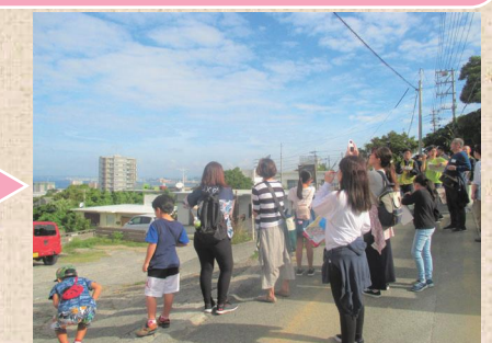
高台から西海岸側の良好な景観を見学