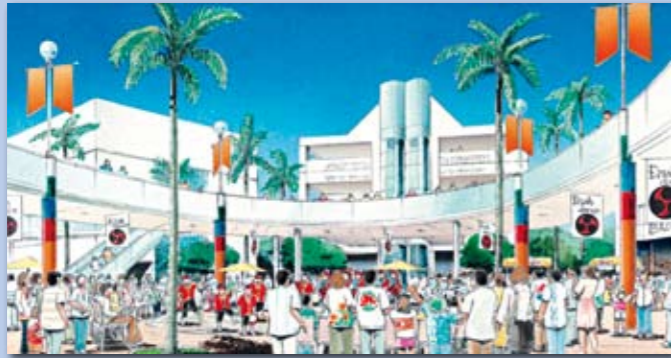
↑市民の交流の場となる新しい都市拠点（イメージ）