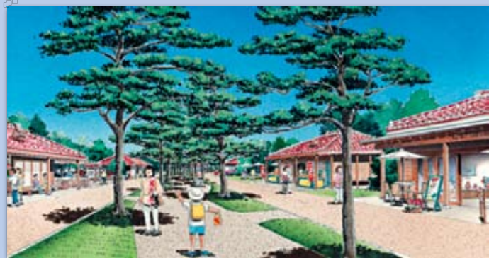
↑歴史を後世に伝える並松街道（イメージ）