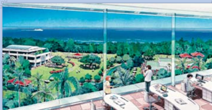
豊かな緑やオーシャンビューが作る沖縄振興の舞台（イメージ）↑