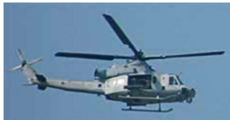
UH-1Y ヴェノム 6機