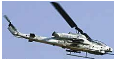
AH-1Z ヴァイパー 12機