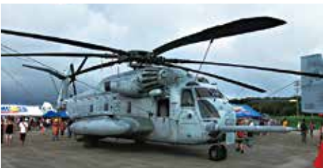
CH-53E スーパースタリオン 12機