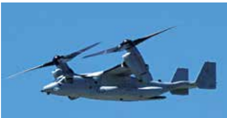
MV-22B オスプレイ 24機