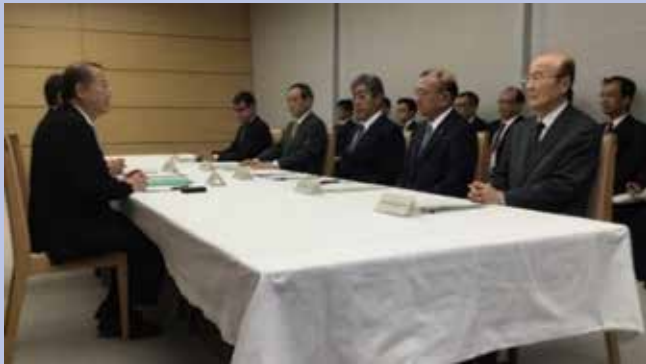
第5回 普天間飛行場負担軽減推進会議