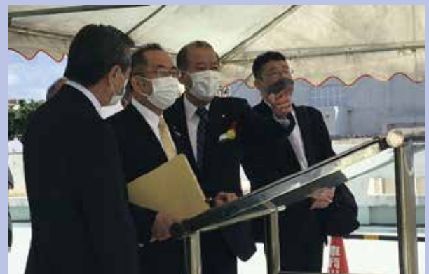
西銘 恒三郎 内閣府特命担当大臣（沖縄及び北方対策）

政府や関係機関の来訪に際しましては、市庁舎屋上や嘉数高台公園展望台から普天間飛行場を視察していただき、市街地に囲まれた普天間飛行場の危険性や、基地被害状況を説明した上で、一日も早い返還の必要性について、理解を求めています。また、速やかな運用停止、返還までの間の負担軽減の実現に向けた取り組みを要請しております。