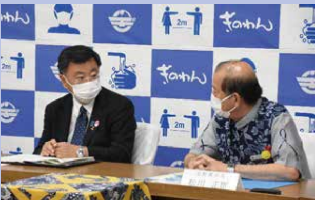
松野 博一 内閣官房長官