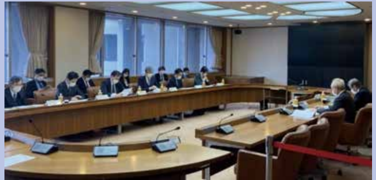
第12回 普天間飛行場負担軽減推進会議作業部会

普天間飛行場の一日も早い閉鎖・返還と返還されるまでの間の危険性の除去及び基地負担軽減の実現に向けた取り組みとして、政府、沖縄県、宜野湾市の三者で構成される『普天間飛行場負担軽減推進会議・作業部会』が開かれております。その成果の一つとして、平成26（2014）年に普天間飛行場所属のKC-130空中給油機全15機の岩国飛行場への移駐が完了しました。また、オスプレイ等の県外・国外への訓練移転については、平成28（2016）年度より、これまで14回実施しており、市民が実感できる負担軽減策として今後とも強く求めてまいります。