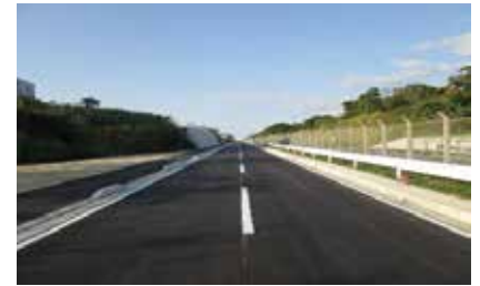
（2キロ区間）道路整備状況（R3.3）