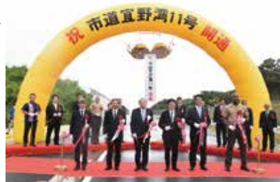
市道宜野湾11号 道路開通式