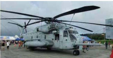
CH-53E スーパースタリオン 12機