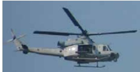
UH-1Y ヴェノム 6機