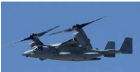
MV-22B オスプレイ 24機