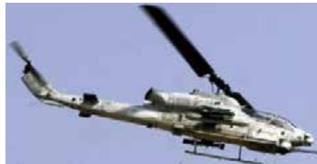
AH-1Z ヴァイパー 12機