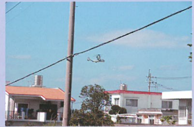
住宅地上空を飛行するオスプレイ