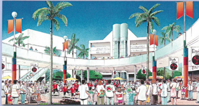
↑市民の交流の場となる新しい都市拠点（イメージ）