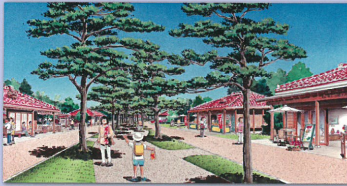
↑歴史を後世に伝える並松街道（イメージ）