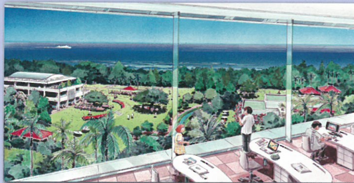
豊かな緑やオーシャンビューが作る沖縄振興の舞台（イメージ）↑