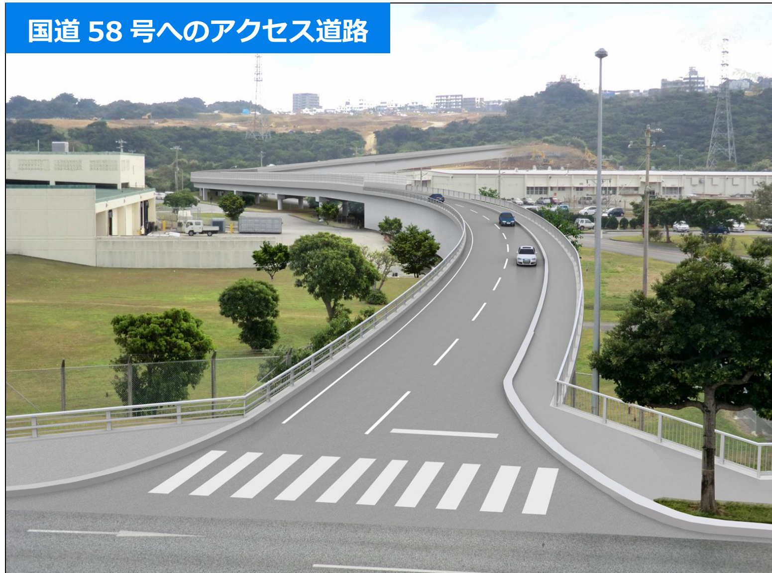
国道 58 号へのアクセス道路