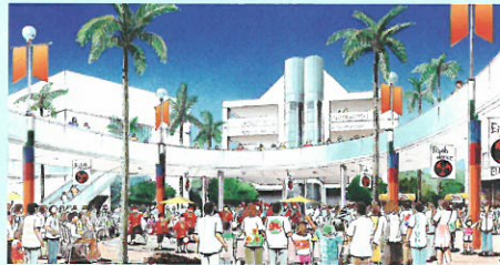
↑市民の交流の場となる新しい都市拠点