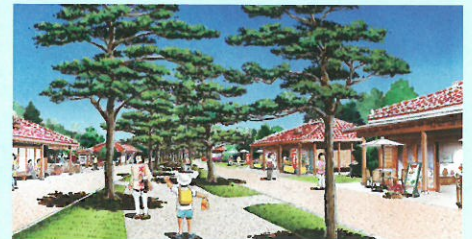
↑歴史を後世に伝える並松街道