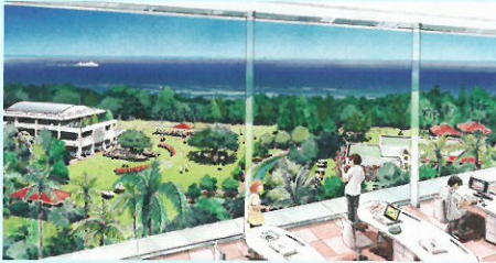
↑豊かな緑やオーシャンビューが作る 沖縄振興の舞台