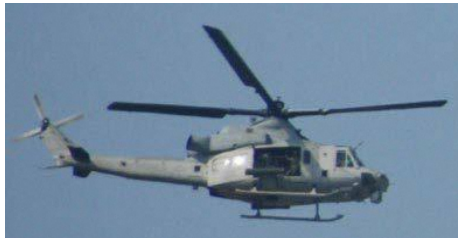
UH-1Y ヴェノム 6機