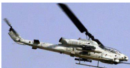
AH-1Z ヴァイパー 12機