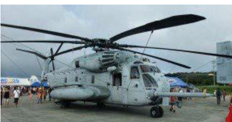
CH-53E スーパースタリオン 12機