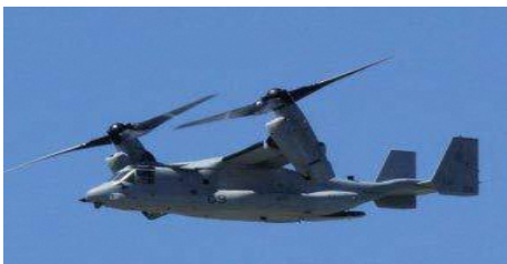
MV-22B オスプレイ 24機