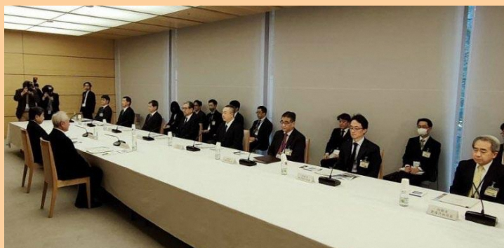
第14回 普天間飛行場負担軽減推進会議作業部会

普天間飛行場の一日も早い閉鎖・返還と返還されるまでの間の危険性の除去及び基地負担軽減の実現に向けた取り組みとして、政府、沖縄県、宜野湾市の三者で構成される『普天間飛行場負担軽減推進会議・作業部会』が開かれております。その成果の一つとして、平成26（2014）年に普天間飛行場所属のKC-130空中給油機全15機の岩国飛行場への移駐が完了しました。また、オスプレイ等の県外・国外への訓練移転については、平成28（2016）年度より、これまで20回実施しており、市民が実感できる負担軽減策として今後とも強く求めてまいります。