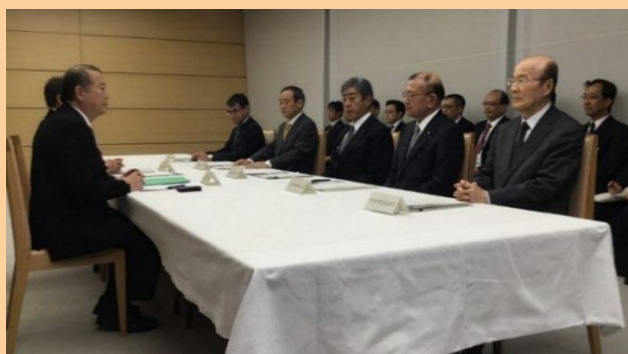
第5回 普天間飛行場負担軽減推進会議