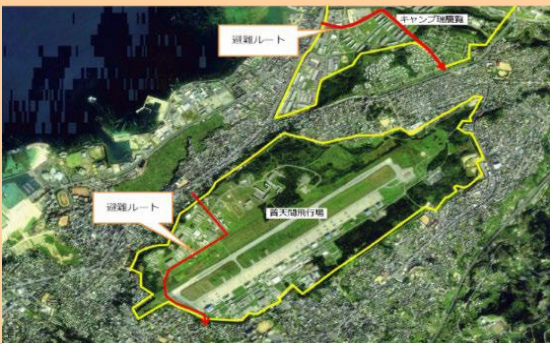
災害時利用可能な避難ルート（赤線）

市内に所在している普天間飛行場、キャンプ・フォスター、海軍病院の各司令官と、現地レベルで解決可能な議題を協議する場として「クォーターリーミーティング」を開催し、お互いが抱える諸課題の解決に向け建設的に取り組んでおります。