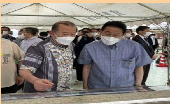
岸田 文雄 内閣総理大臣