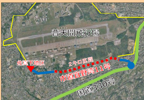
返還部分： ▼ 佐真下地区（約990㎡） ■ 東側沿いの土地（約4ha）

平成29（2017）年7月に返還された普天間飛行場東側沿いの土地（約4ha）において、道路網の強化・国道330号の渋滞緩和を目的とした市道宜野湾11号の整備を進めてきました。