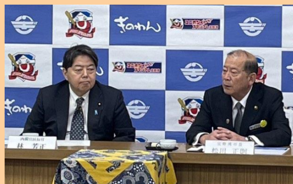
林 芳正 内閣官房長官

政府や関係機関の来訪に際しましては、市庁舎屋上や嘉数高台公園展望台から普天間飛行場を視察していただき、市街地に囲まれた普天間飛行場の危険性や、基地被害状況を説明した上で、一日も早い返還の必要性について、理解を求めております。また、速やかな運用停止、返還までの間の負担軽減の実現に向けた取り組みを要請しております。