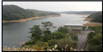
福地ダムの様子(12/31 14時)