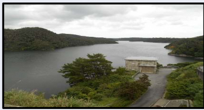
福地ダムの様子(参考: R1.6.21 100%記録時)