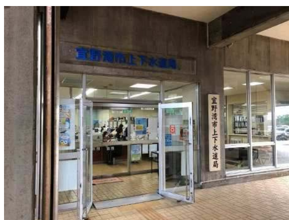
写 1.1.1 宜野湾市上下水道局 入口

市民生活を支える重要なライフラインである上下水道事業の運営を持続可能にするための基本計画として、平成 30(2019)年から 10 年計画となる「宜野湾市上下水道事業経営戦略」を策定しました。