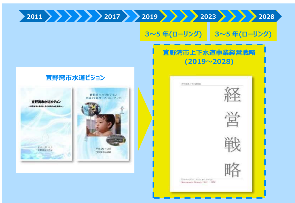
図 1.4.1 経営戦略の計画期間

計画期間は、2019年度から2028年度までの10年間とし、策定から3～5年の間に経営状況を踏まえながら計画の見直し(ローリング)を実施します。