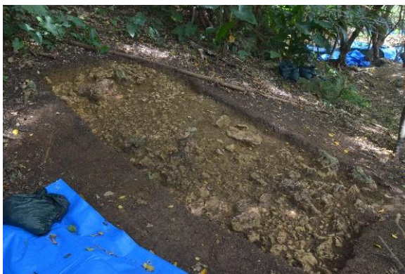
歴史の道の調査（れき敷遺構）

埋蔵文化財の発掘調査報告書については、本市が文化庁の国庫補助を受けて平成 28～30 年度に実施した西普天間住宅地区返還跡地における予備調査の成果を所収した「基地内埋蔵文化財調査報告書 8」と、同じく文化庁の国庫補助を受けて平成 30 年・令和元年度に実施した民間地の試掘調査の概報である「宜野湾市内遺跡発掘調査の概要」を刊行した。