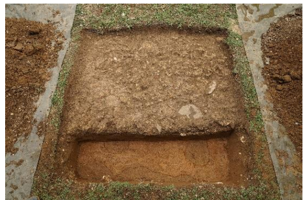
嘉数同原遺跡の調査（遺構検出）