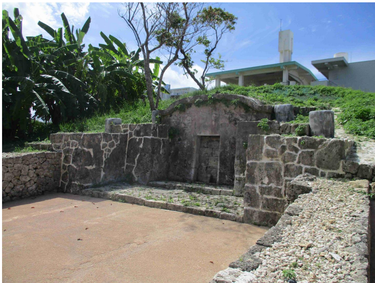
市指定史跡 本部御殿墓(令和 3 年 2 月 25 日指定)