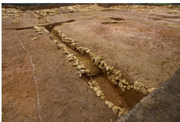
溝跡の検出状況（喜友名下原第二遺跡）