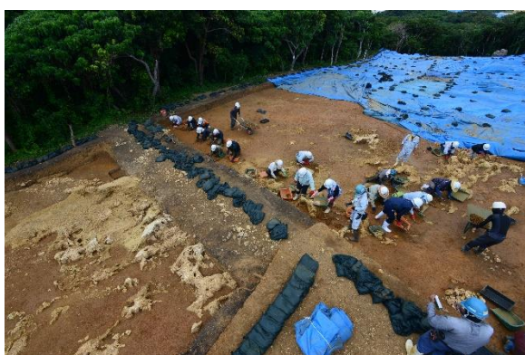
喜友名下原第二遺跡 作業状況