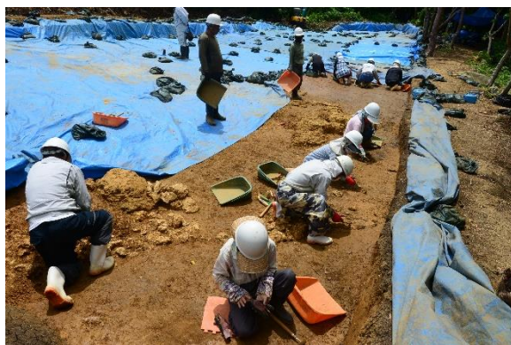
喜友名下原第一遺跡 作業状況

成果：石積みや石列で形成された土留め、排水のための溝などが検出された。調査区域一帯は戦前まで耕作地として使用されており、これに関連する遺構と思われる。調査区の北側は段々状の地形を呈しており、耕作地を広げるために人為的に土地造成が行われていることが判明した。