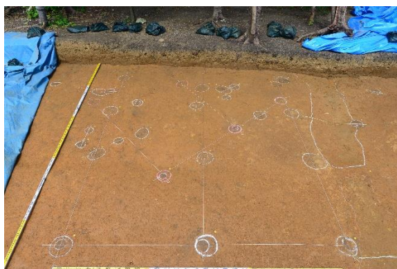
柱の跡検出状況（喜友名下原第一遺跡）