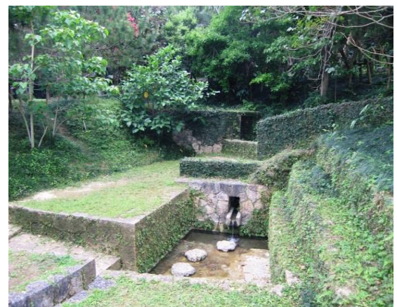
【県指定文化財】(名勝) 宜野湾市森の川

蔵骨器正面中央の銘文にある「おろく大やくも い」の「おろく」は、集落名を、「大やくもい」は、琉 球王国時代の高級官人の肩書をあらわしてい ます。