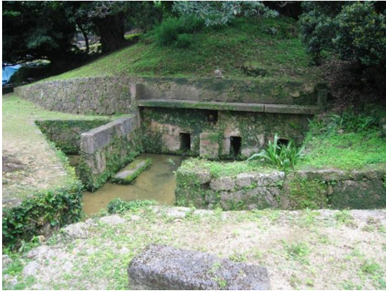
【国指定有形文化財】(有形文化財[建造物]) 喜友名泉① カーグー

布積みと相方積みの併用で精巧に噛み合う石積み が施され、3ヶ所の湧水口には石樋が架かります。安 置する香炉の銘文から、明治 22 年に新造もしくは修 造されたようです。