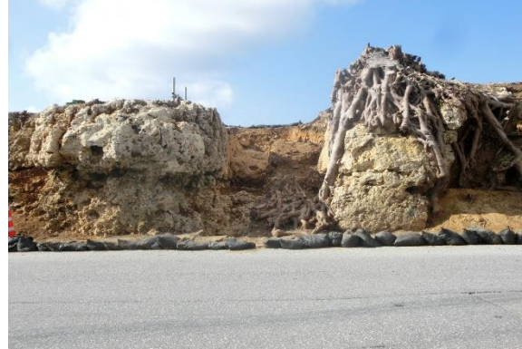
佐真下ゲート前・石灰岩を切り通した通路跡