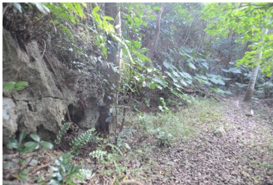
【国指定文化財】(史跡)大山貝塚

布積みを基調とした堅牢な造りで、巨石造りです。 東壁に2ヶ所、南壁に1ヶ所の湧水口があります。東 側の壁には紐くり石があり、牛馬の手綱を結んだよ うです。