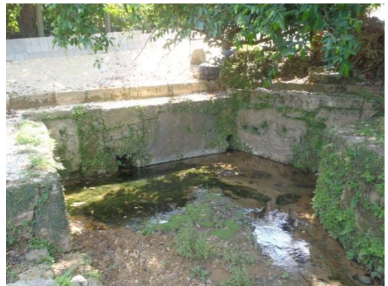
【国指定有形文化財】(有形文化財[建造物]) 喜友名泉② ウフガー

布積みと相方積みの併用で精巧に噛み合う石積み が施され、3ヶ所の湧水口には石樋が架かります。安 置する香炉の銘文から、明治 22 年に新造もしくは修 造されたようです。