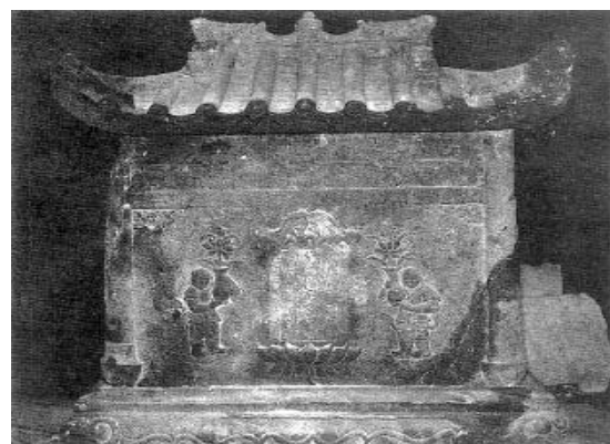
【県指定文化財】(有形文化財[彫刻]) 小禄墓内石厨子

比屋良川沿いの断崖に横穴状に掘り込んだ、数 百年にさかのぼる古い墓群の一つで、小禄墓 は、幅 8.5m、高さ 2.4mを測ります。