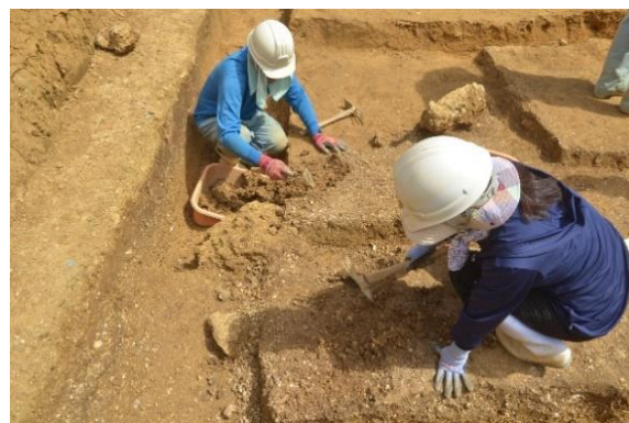
伊佐伊利原遺跡・発掘調査の様子