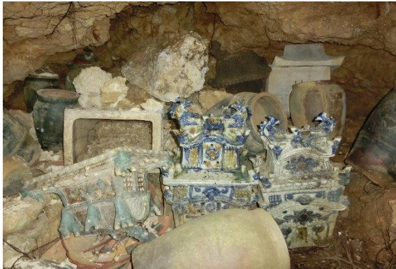
市道宜野湾 11 号・古墓内部状況

市道宜野湾 11 号及び佐真下ゲート前の開発工事に伴い、緊急発掘調査を実施した。市道宜野湾 11 号の箇所では戦前まで使用されていた古墓、佐真下ゲート前では石灰岩を切り通した通路跡を調査した。調査の結果、古墓の使用年代や切り通しの構築年代などが概ね把握できた。