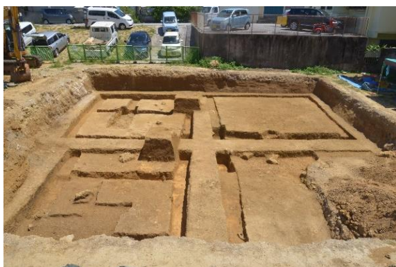
伊佐伊利原遺跡・全景

個人住宅・共同住宅及び開発工事に伴う試掘調査を令和元年度は7件実施しており、そのうち新規に「伊佐伊利原遺跡」を確認した。その後、「伊佐伊利原遺跡」は緊急発掘調査も実施して、縄文時代（約 4500 年前）の土器である面縄前庭式土器、弥生～平安並行期（約 2500～1000 年前）の土器や石斧などが確認された。