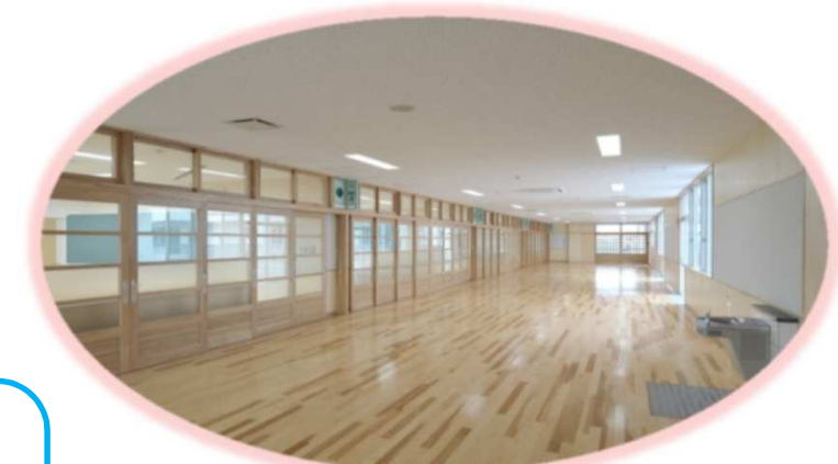
※クローズ時イメージ写真

※普通教室と多目的スペースの間仕切りを全オープン・可動間仕切りとし、オープン・クローズ両方に対応できる。