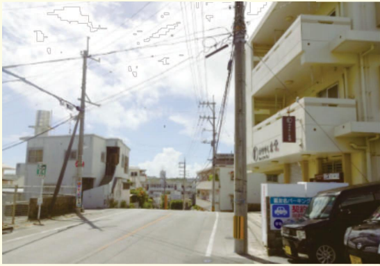
▲どこにでもある住宅地を抜ける道路、この先が急な坂道になっています。

左上の写真は、喜友名のシオン幼稚園前の通りです。急な坂のある場所ので、反対車線の車や人が見えづらくなっています。実は、戦前ここに道はなく、畑が広がっていました。戦後、なぜ道になったのか分かるのが左下の写真です。道路上に白い建物があります。これは、バルブボックスです。戦後、米軍は燃料送油管（POL・パイプライン）を主要な各基地間に敷設（敷設）しました。数年後、地中化した際の点検用の建物で、数百mごとに道路上に建てられています。