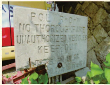
▲現在も残るパイプラインが敷設された時のコンクリート標識「軍油線道路 許可なき車の通行を禁ず」とあります。

市立博物館 ☎870-9317 【問合せ】 た。現在は返還されて見ることはできませんが、当時の状況をシオン幼稚園の裏の標識とパイプライン通りの地名が物語っています。