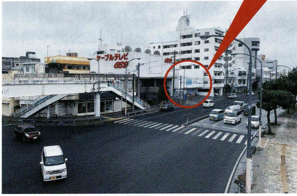
▲普天間交差点から撮影した写真

始まりました。戦後は1948(昭和23)年から映画館ができ始め、1960(昭和35)年には120もの映画館があったほど(『沖縄まぼろし映画館』参照)、映画は昔から市民権を得ていました。それは、かつて普天間でも多くの映画館がつくられていたことからうかがえます。