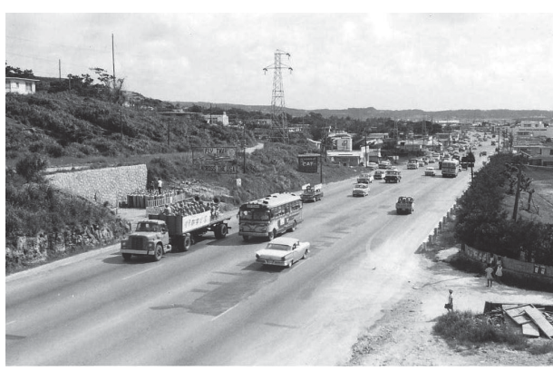
▲大山の給油所近くから真志喜を望む 1964 (昭和 39) 年 写真右側の空き地奥が給油所で、左側にはガスボンベらしきものあり、この擁壁は現在も見られます。

軍用一号線は、戦前の県道である「国頭街道」を、米軍占領下において、那覇軍港・普天間基地・嘉手納基地を結ぶ大動脈として整備されました。宜野湾でも伊佐から大謝名・宇地泊にかけて整備されました。写真は、大山から真志喜方面を撮影した写真です。中央に片側2車線の一号線があり、丘陵側にパイプラインが走り、高圧電線が軍道近くに建てられています。