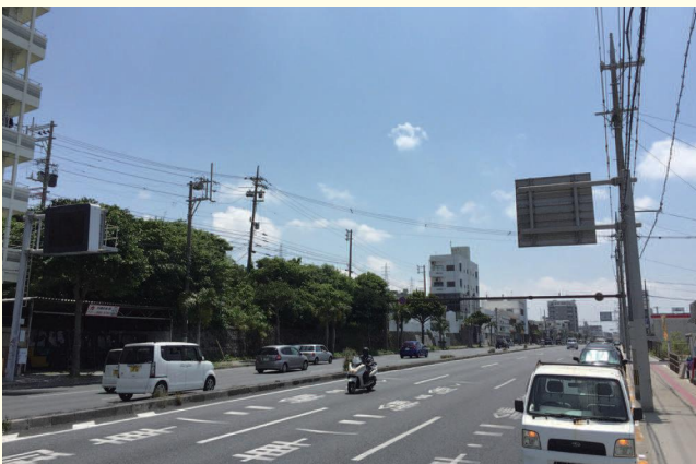
▲現在の写真 片側3車線になり、歩道も整備されています。