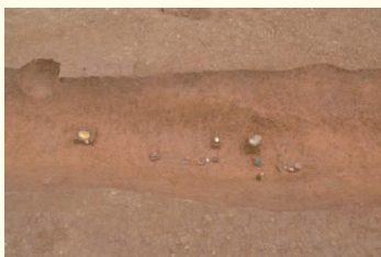
新城大道原第三遺跡 溝の底から陶器片が出土