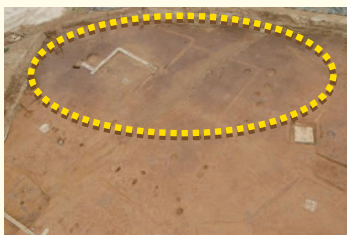
新城大道原第二遺跡北西側 黒い地層が古い遺物を含む

と思われる土器などを含む地層が一部残っていました。その地層を掘り上げ、もう何も出ないから調査を終了しようかという時に土器が頭を出しているのに気が付き、急いで掘り下げを行うという場面もありました。調査終了間際に何かを見つけてしまうのは、発掘調査あるあるなのかもしれません。