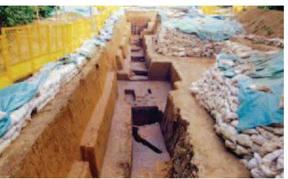
△野高タマタ原遺跡の発掘調査