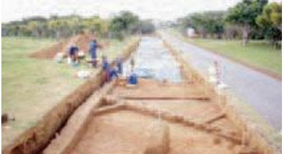
△新城古集落の発掘調査

なお、野高タマタ原・上原濡原遺跡は、古老が語る土地が肥沃とされるチーシル(地汁)がしみ出るクルマーシ(黒真土)の場所にあります。