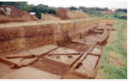
△上原濡原遺跡の発掘調査