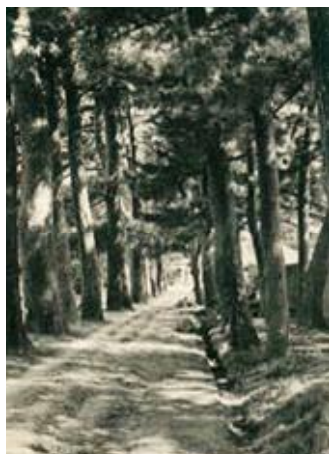
▶戦前、国の天然記念物にも指定された宜野湾並松（普天間）

もたらし、人々の生活が発展しましたが、国を挙げての戦争に人々を巻き込んでいった時代でもありました。市立博物館では、このような激動の時代であった近代をとりあげた秋の特別展「近代沖縄と宜野湾」を開催します。明治・大正・昭和初期という近代のあゆみをたどることで、地元の歴史を知ってもらい、将来の宜野湾を考えるきっかけになればと思います。多くの方々のご来場、心よりお待ちしております。