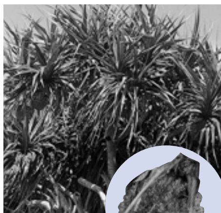
旧海岸の生き証人 アダンの木と実(大山)