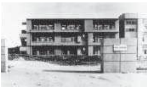
創立当時の校舎 1965(昭和40)年

て、教育界を中心に強い反発を招きました。市や教育界からの度重なる申し入れの末、ユースカーも徐々に態度を軟化させ、一九六五（昭和四〇）年、ついに中部商業が我如古に開校しました。現在では、バレーボールや野球などのスポーツ面での活躍も目覚しく、さらなる発展が期待されています。