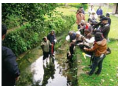
地域の文化財に学ぶ！

さらに、去る沖縄戦において、多くの人命とともに数多くの自然・歴史・文化的財産を失った私たち市民にとって、その価値はより高いものといえますし、児童・生徒にとって人が持つて生まれた人としての知恵と工夫を教える生きた学校教材でもあります。