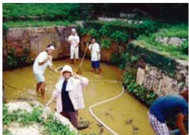
地域の文化財を活かす！