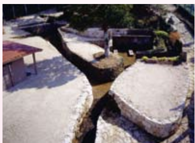
地域の文化財を守る！

び都市化の波によって、戦前来の古い村落に關わる歴史・文化遺産は減少の一途をたどり、私たち宜野湾特有の伝統的知識と技術を記憶に残す古老年を追うにつれて数少なくなっており、その継承が危ぶまれています。