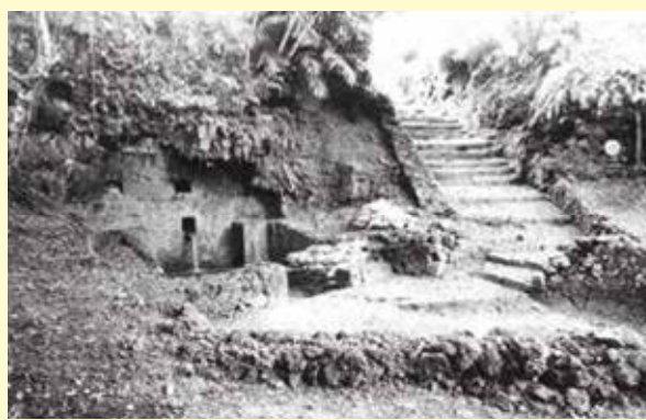
▲若水を汲んだとされる、我如古ヒージャーガー 1976(昭和51)年

「宜野湾市史」への問合せ 文化課 市史編集係(市立博物館内) ☎8700-9317