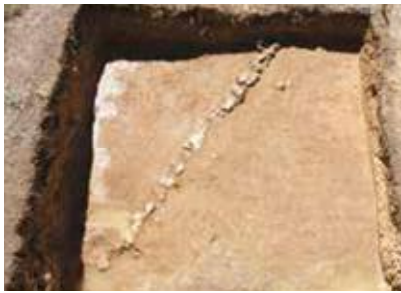
土留めと考えられる石列

試掘調査の成果 約二十箇所での調査ですが、二十m程の石灰岩を一行に並べた石列や柱が立てられていたと考えられる穴の跡(遺構)が三箇所で確認されています。石列は、戦前(近世)江戸時代相当頃での土留めであると考えられます。穴の跡は二