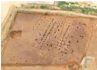
海軍病院移設予定地にて確認された掘立柱建物跡