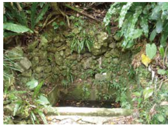
神山・愛知ヌールガー