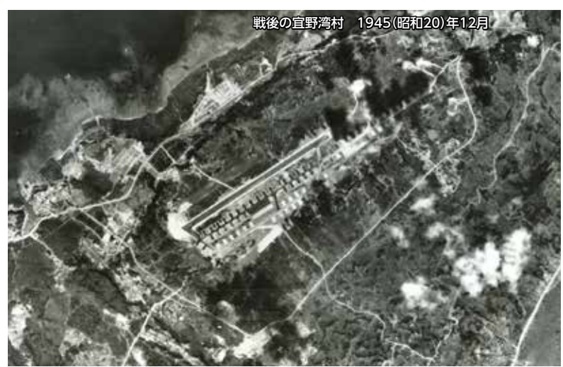
戦後の宜野湾村 1945(昭和20)年12月

村中央には沖縄戦の最中に作られた普天間飛行場があり、至る所に軍用施設がありました。