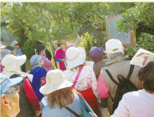
▲市民へ市の歴史文化を説明する文化財ガイド。

文化課の主催するガイド養成講座を受講し、宜野湾市の歴史・文化に関する知識を問う試験、実際にガイドを行う実地試験に合格する必要があります。平成16年度に1期生、平成27年度に2期生を養成しました。