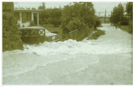
▲1973 (昭和48)年 大謝名 右奥の人の膝まで水がきています。

実は、大謝名の南には志真志川が流れていて、現在の嘉数中学校あたりから、地下へもぐっていました。この大