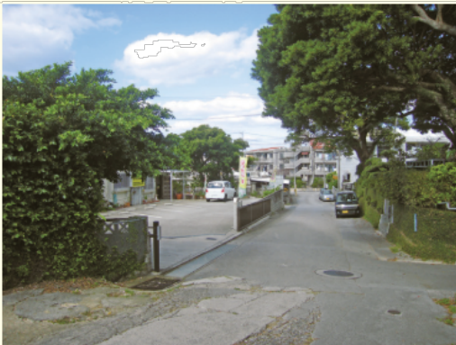
▲2017 (平成29)年 建物は、変わりましたが、ブロック塀などは変わらず。屋敷林は更に豊かになっています。