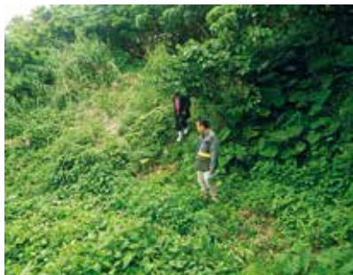
中頭方西海道と思われる道跡

中でも沖縄本島西側を北上するルートは西海道(せいかいどう)と呼ばれており、恩納村では「国頭方西海道」、浦添市では「中頭方西海道及び普天間参詣道」が、いずれも周辺文化財とセットで、国指定史跡として整備されています。