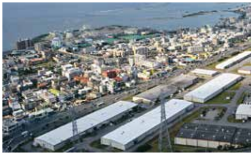
▲ 現在の伊佐浜の埋立地 2014(平成26)年

す。事業規模が莫大だったため、なかなか政府の認可が下りませんでした。1967(昭和42)年には宜野湾市と琉球政府設置の琉球土地住宅公社を事業主体とした公有水面埋立工事がスタートし、翌年その一部が竣工しました。