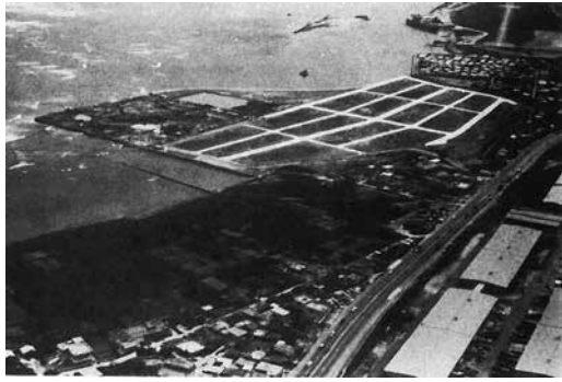
▲ 伊佐浜の公有水面埋立地 1968(昭和43)年 この年1月には約18haの埋立が竣工しました。

宜野湾市は市域を普天間飛行場やキャンブ瑞慶覧が占有するため、都市計画の上で大きな障害となっています。そのため、昭和30年代後半頃から西海岸地域の埋め立てが検討されてきました。そして1964(昭和39)年、伊佐・大山・真志喜・宇地泊・大謝名地域の海岸を埋め立てて、市街地を拡大する計画が決まったので