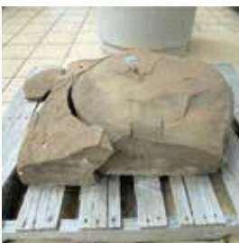
写真② 首里城の「礎石（そせき）」。火災によって変色やひび割れが生じています。