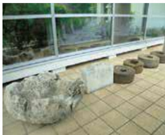
写真① 玄関横に並べられた石製の資料たち。左側から「ンムアライトーニ」、「チール石（ウコール石）」、4個の「サーターグルマ」