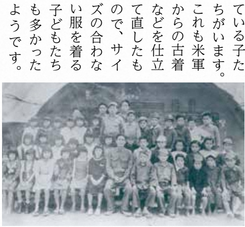
▲嘉数小学校第一期卒業生1949(昭和24)年

左上の写真は、1949（昭和24）年の嘉数小学校の卒業記念写真です。児童たちの背後には、米軍から払い下げられたコンセットと呼ばれるカマボコ型の簡易的な建物が写っていますが、当時はコンセットなどを校舎として利用していました。また、児童たちを見てみると、服装が似