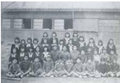
▲宜野湾小学校卒業記念1951(昭和26)年