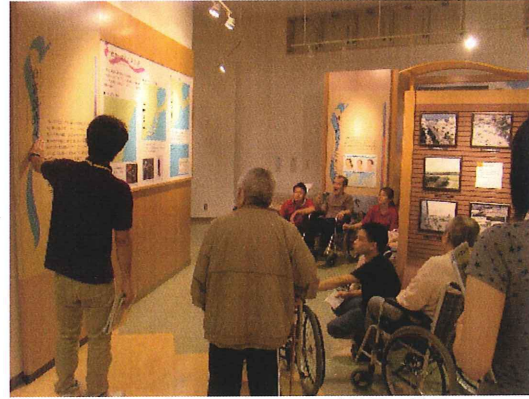
↑デイサービスセンターでのご利用の様子