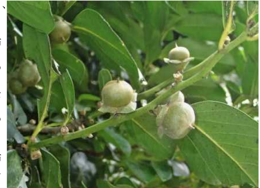
上：公園入口近く、慰霊塔の斜面に生えているリュウキュウガキ。

公園の入り口から入って、左手の慰霊塔(森川の塔)の斜面沿いをすこし覗いてみて下さい。黄色の小さな実をつけた枝を見つけることができます。葉をじっくりと見ると、柿の木の葉によく似ていることが分かります。これが森川公園のカキ、リュウキュウガキです。沖縄の在来種の柿の木の仲間です。琉球石灰岩の森に普通に生えているけど、残念ながら実は食べられないよ。