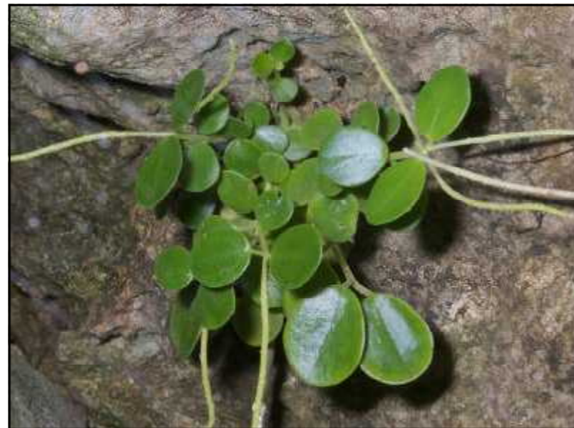
上：まるで枯れ木のようになった公園のコパティシ。