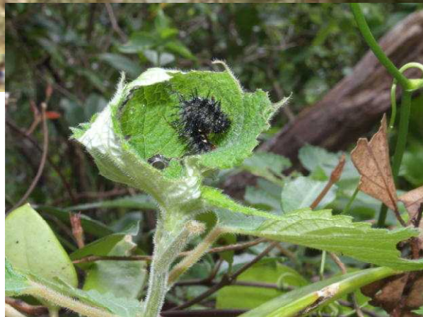
左：カラムシの葉を丸めて隠れているアカタテハの幼虫。