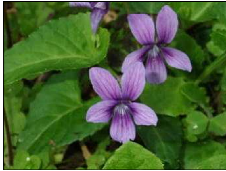
上：薄紫色のかわいいリュウキュウコスミレの花 ⇒