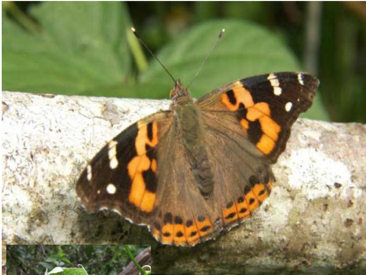
上：道ばたの枯れ木にとまるアカタテハのオス。