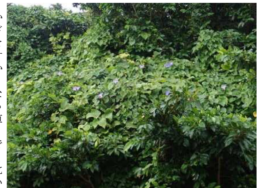
上：グランド前のカーブ正面のガジュマルに生い茂ったノアサガオのマント。

これは自分では立つことができないツル植物が、別の木により掛かって伸びて樹上に出たもので、ツル植物がつくる森の景色のひとつです。こうした景色をマント群落と呼んでいます。マント群落はその名の通り、森のマントの役目を果たし、強い北風から森の内部が乾燥するのを防いだり、強い雨が直接当たって、植物や地面が傷つけられることから保護しています。