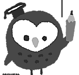
就学援助 イメージキャラクター ツクロウくん

学校教育法などにもとづいて、小中学校の子どもがいる家庭に学用品費や学校給食費などを市町村が援助する制度です。子どもたちの安心して楽しい学校生活のために、気軽に就学援助制度を活用してみませんか。