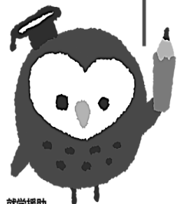
就学援助 イメージキャラクター ツクロウくん

学校教育法などにもとづいて、小中学校の子どもがいる家庭に学用品費や学校給食費などを市町村が援助する制度です。子どもたちの安心して楽しい学校生活のために、気軽に就学援助制度を活用してみませんか。