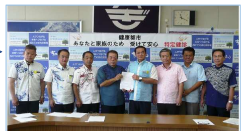
▲政策提言を市長へ手交