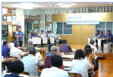
▲議会報告・意見交換会