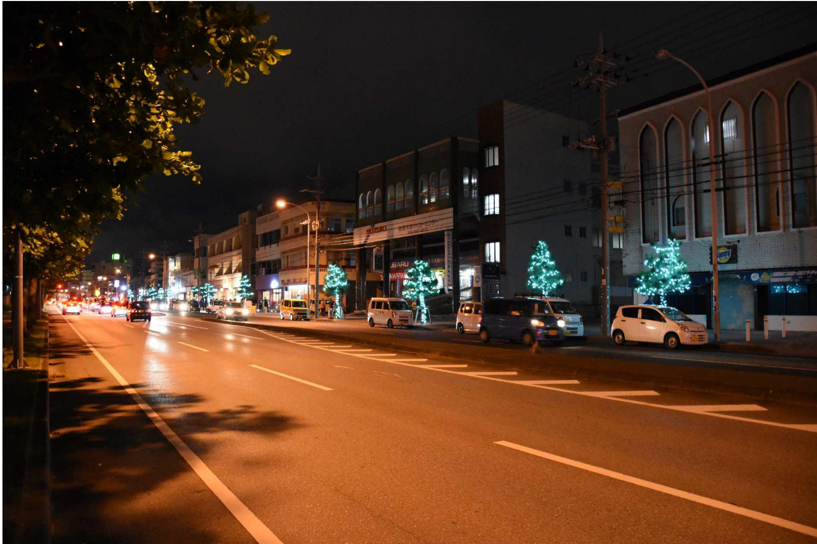
ヒルズ通りイルミネーション