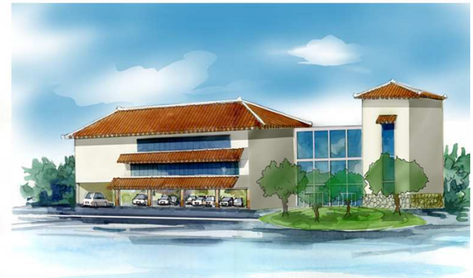
交流施設イメージ