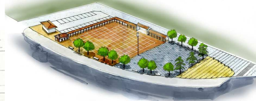
門前広場イメージ