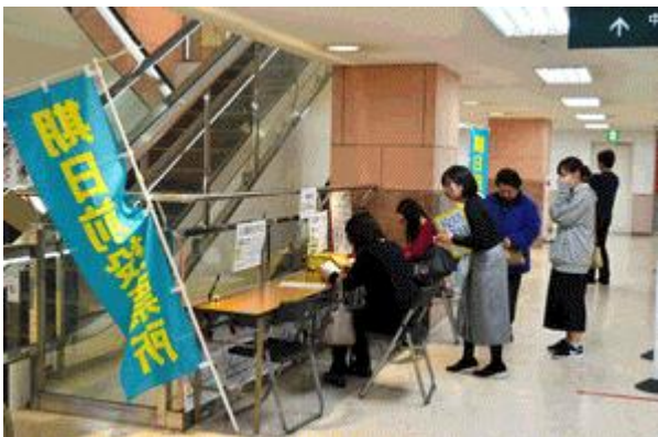
商業施設における期日前投票のイメージ