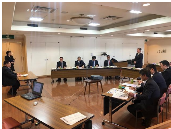
北見市の取り組みについて説明を受ける委員