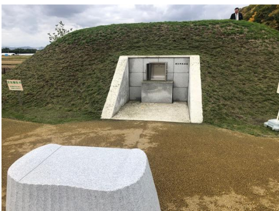
カロートが芝生で養生された共同墓