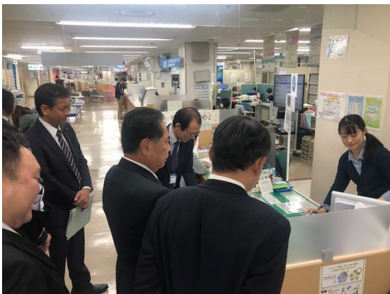
ワンストップサービスの説明を受ける委員