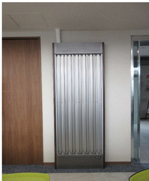
輻射式冷暖房・放射冷暖房システム【省エネ】