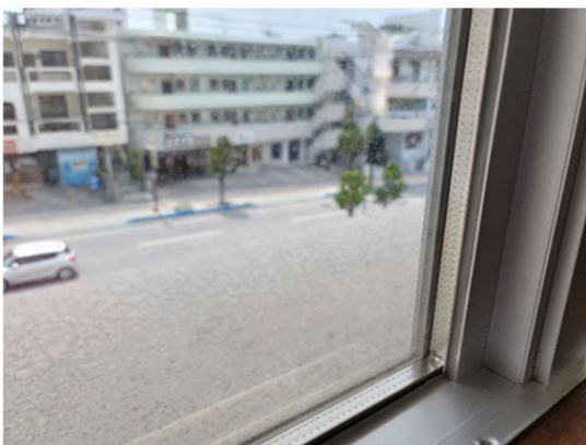
ペアガラス【省エネ】