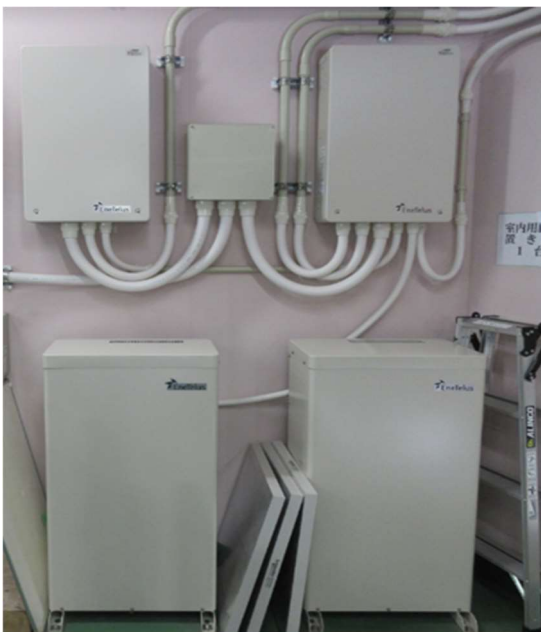
ソーラーパネルの蓄電池【創エネ】