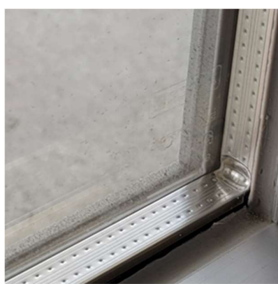
ペアガラス(拡大写真)