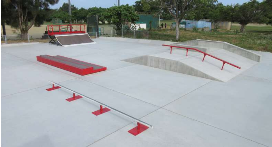
市民広場内に整備されたスケートボード場