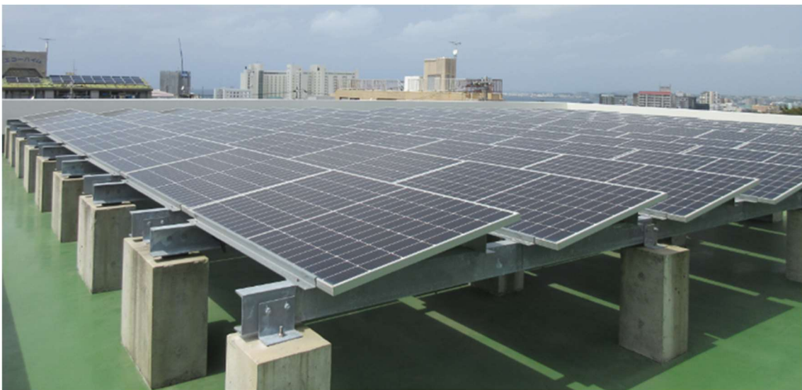
屋外に設置されたソーラーパネル【創エネ】