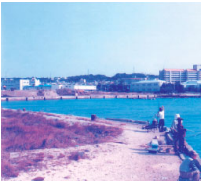
開発が待たれる仮設避難港周辺

◎企画部長 国有地の譲渡については、市と県が協力して対応していくということになっており、安価でできる努力をしていきたいと思っております。護岸整備については、県との調整に入っておりますが、高率補助等の活用も検討しながら進めたいと考えます。