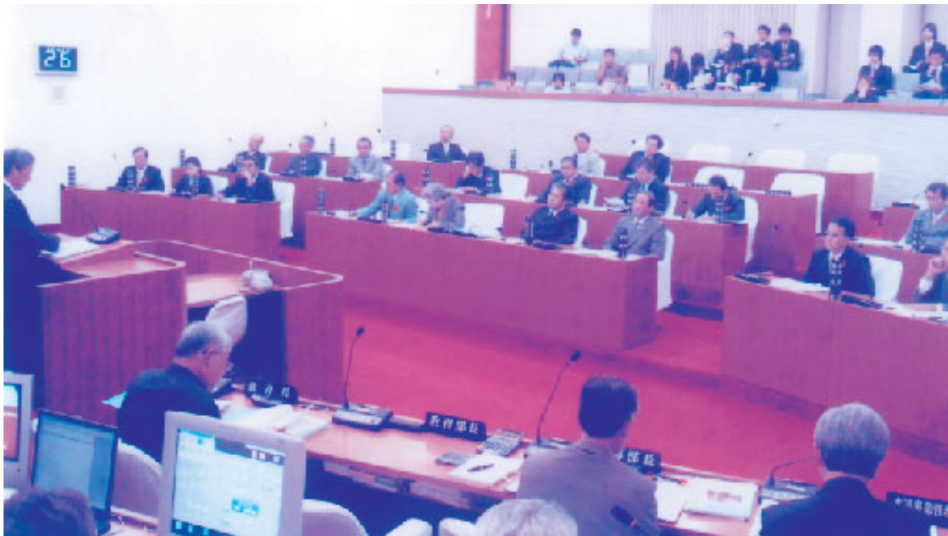
初議会における本会議場の審議風景