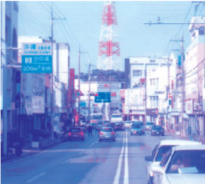
普天間神宮前の商店街通り