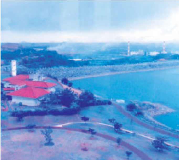
本市への水を供給する倉敷ダム(沖縄市)