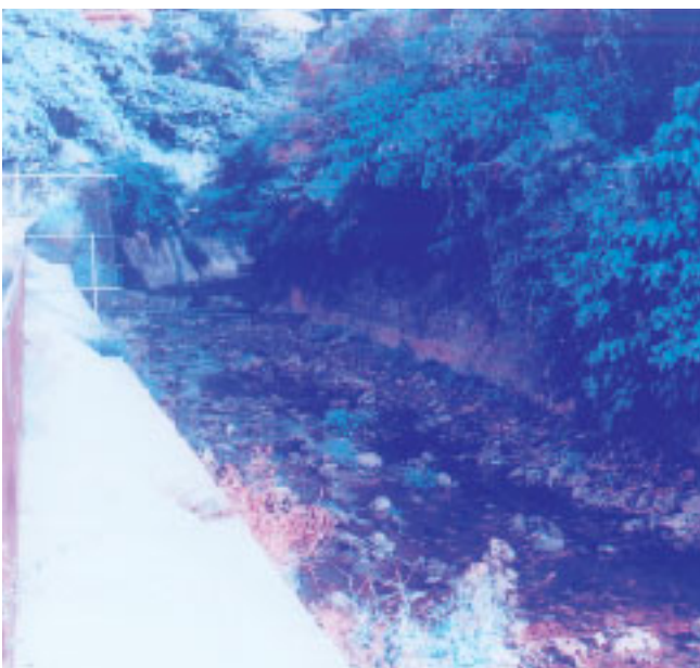
安全対策が指摘された宇地泊川

会議というのを発足させ、利用の方法、施設の安全点検、あり方等々、地域と共に対策を講じていきたいと思っております。 ◎ 教育長 一人のとうい命が失われるという大きな事故が起こり、私たち学校関係者もいろいろ対策を講じてはいますが、細かい部分については、指導部長の答弁にもあります。安全連絡会議で協議しているところでございます。 ◎ 知念吉男議員 再びこのような事故が起こらないように、お願いたします。