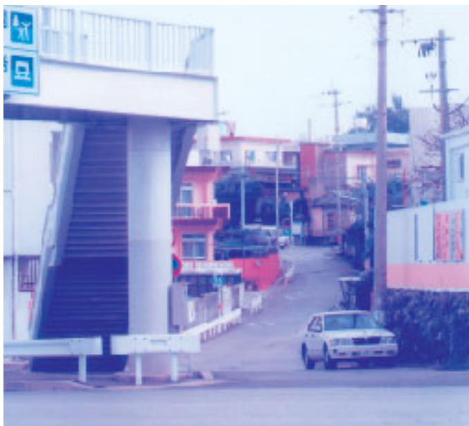
嘉数小学校裏門側の通学路

◎建設部長 歩行者安全工リア指定を受けた場合には、その対策もとれるので、指定に向けて取り組んでいききたい。