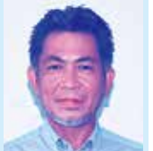
知念 秀明 議員