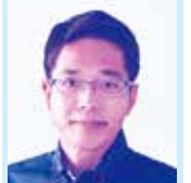
棚原 明 議員