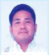
嶺井 拓磨 議員