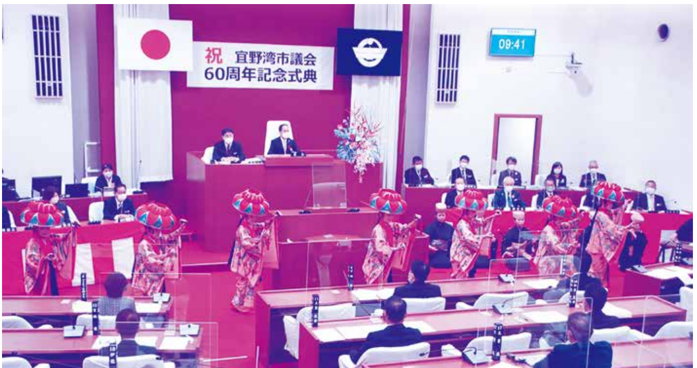
市文化協会の皆様による四つ竹の演舞(令和4年12月6日)

宜野湾市議会60周年を記念した式典が執り行われました。(詳細については2頁参照)