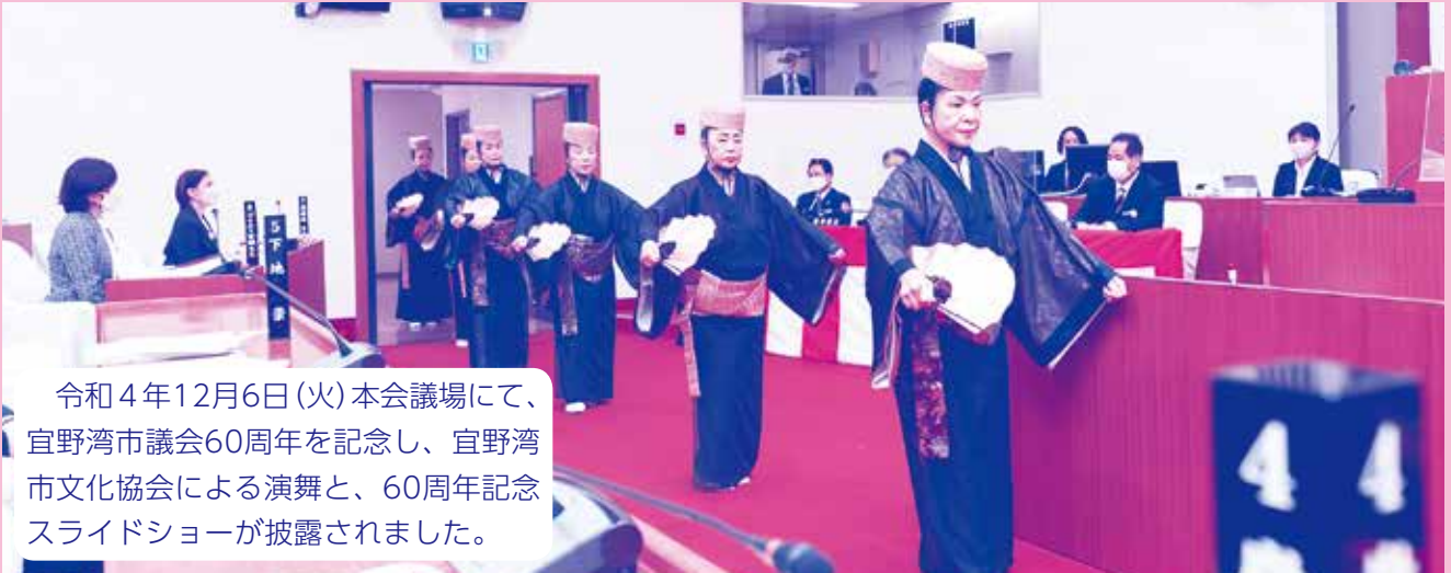
令和4年12月6日(火)本会議場にて、宜野湾市議会60周年を記念し、宜野湾市文化協会による演舞と、60周年記念スライドショーが披露されました。

宜野湾市が誕生して今日まで、市が素晴らしい発展を遂げたのも、市議会の皆様のご尽力があったことだと思えます。これまで同様、様々な課題を克服しながら、市民の生活、福祉の向上にしっかりと市議会と連携を取りながら邁進してまいります。