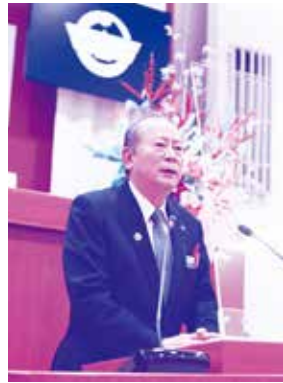
第19代 宜野湾市長 松川正則

宜野湾市が誕生して今日まで、市が素晴らしい発展を遂げたのも、市議会の皆様のご尽力があったことだと思えます。これまで同様、様々な課題を克服しながら、市民の生活、福祉の向上にしっかりと市議会と連携を取りながら邁進してまいります。