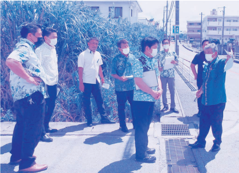
現場視察を行う経済建設分科会委員

宜野湾市議会基本条例（平成28年7月1日施行）に基づき、5月16日（火）、17日（水）に「議会報告及び市民との意見交換会」を開催し、参加した皆様やインターネット等により多くのご意見を頂きました。