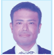
又吉 亮 議員

◎議員 総合戦略、基本目標三、市民の希望実現に向け安心して結婚・出産・子育てができる環境を整えるところがあるが、具体的施策がなく、どのような施策を展開しているか伺う。