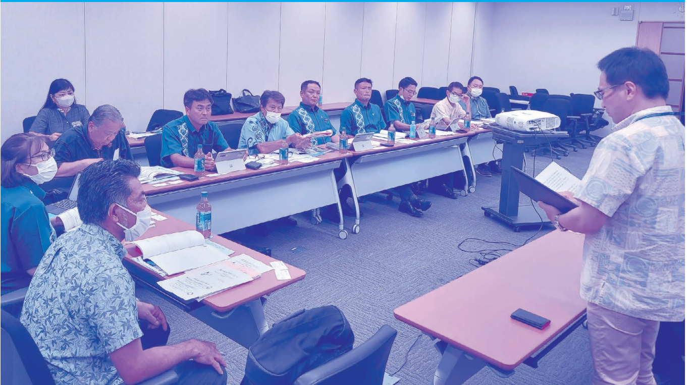
茅ヶ崎市にて視察する議会改革に関する調査特別委員会委員(令和5年8月1日) ※詳細については11頁参照